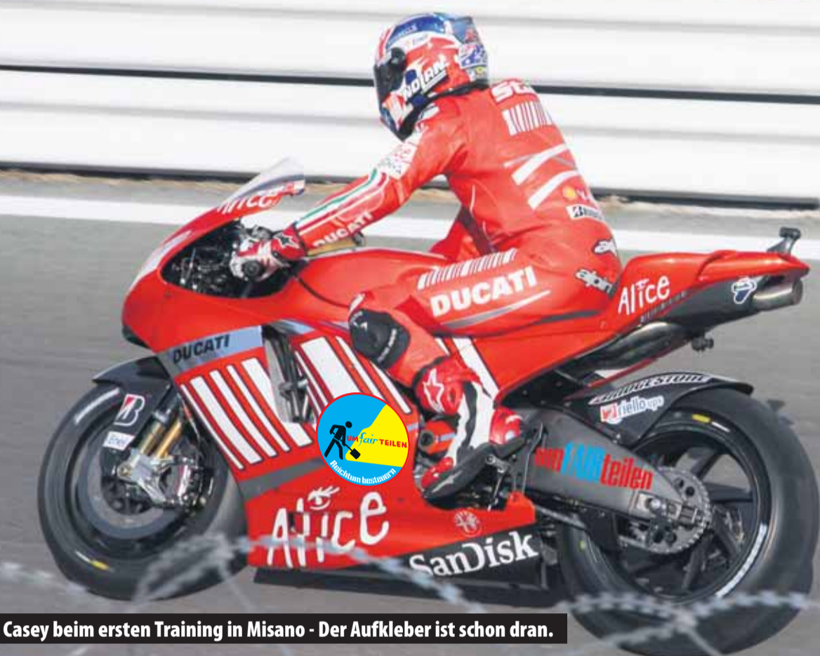
Casey beim ersten Training in Misano - Der Aufkleber ist schon dran.

Grün waren sich Casey und Valentino nicht immer. Doch in der nächsten Saison rasen die beiden Ex-Weltmeister gemeinsam für das Team redistribute . Das neue Zweigespann ist geballte Kraft im Motorradsport. „Wir möchten ein Zeichen gegen Steueroasen setzen. Internationale Solidarität ist wichtig,“ so Casey zu BALD. „Und wir werden siegen!“, sagt Valentino lächelnd in die Kamera.